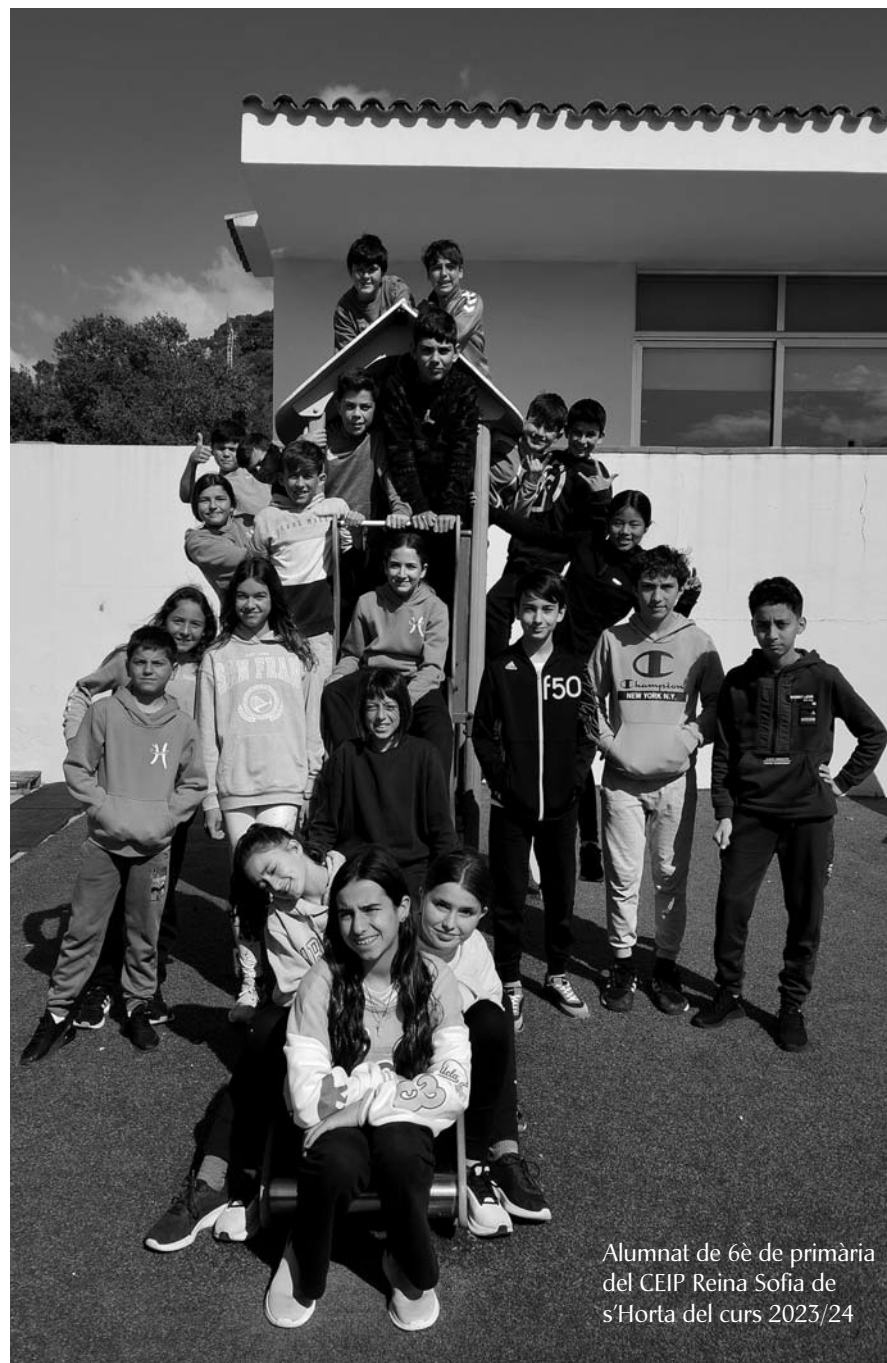
Alumnat de 6è de primària del CEIP Reina Sofia de s’Horta del curs 2023/24