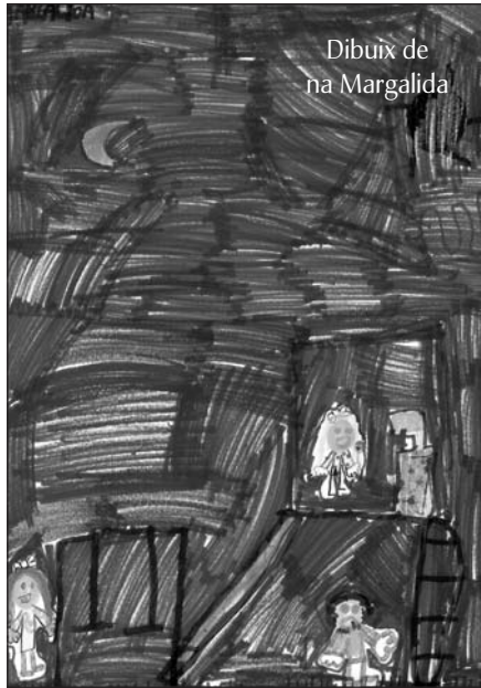
Dibuix de na Margalida