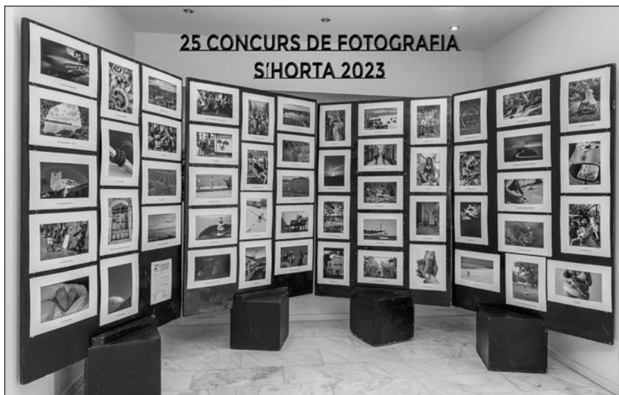
25 CONCURS DE FOTOGRAFIA