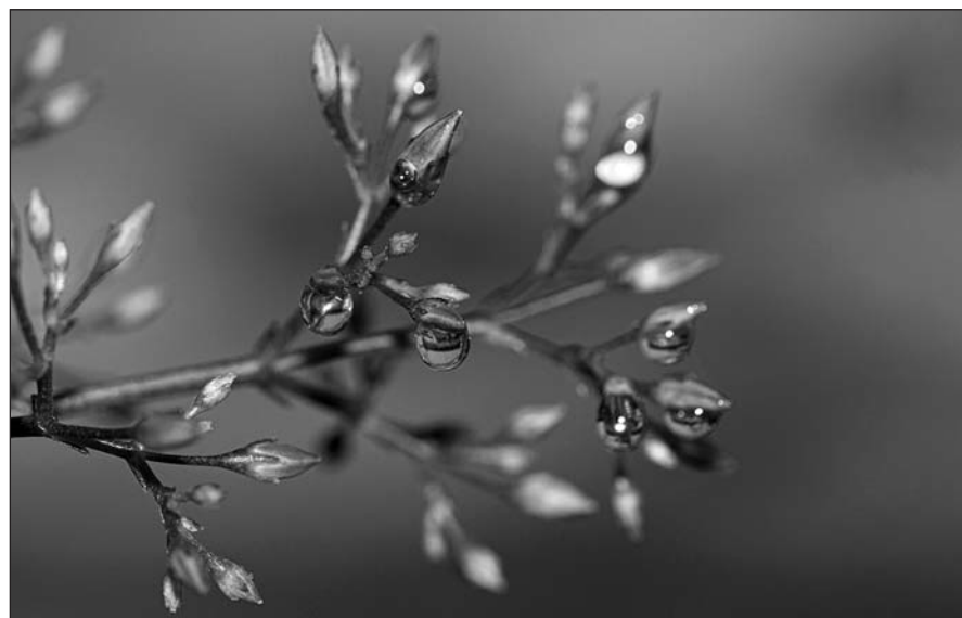
CONCURS DE FOTOGRAFIA 2023 - 2n premi Autor: Carles Arrufat. Títol: Las gotas de la vida