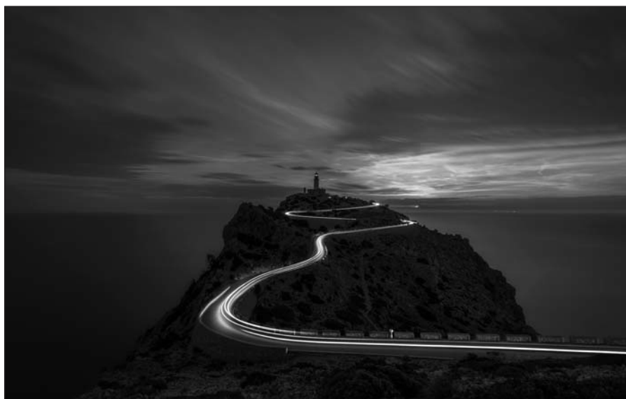
CONCURS DE FOTOGRAFIA 2023 - 1r premi Títol: Amanecer en el faro de Formentor