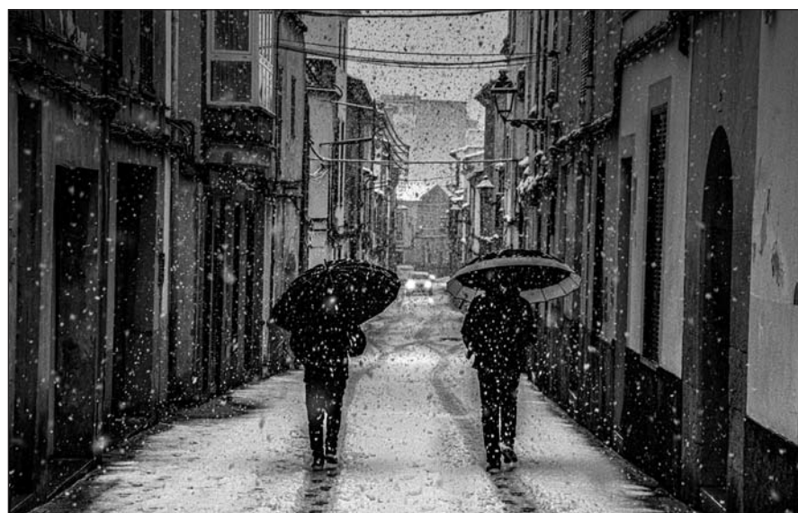
CONCURS DE FOTOGRAFIA 2023 - 3r premi Autor: Llätzer Méndez. Títol: Carrer d'es Juevert