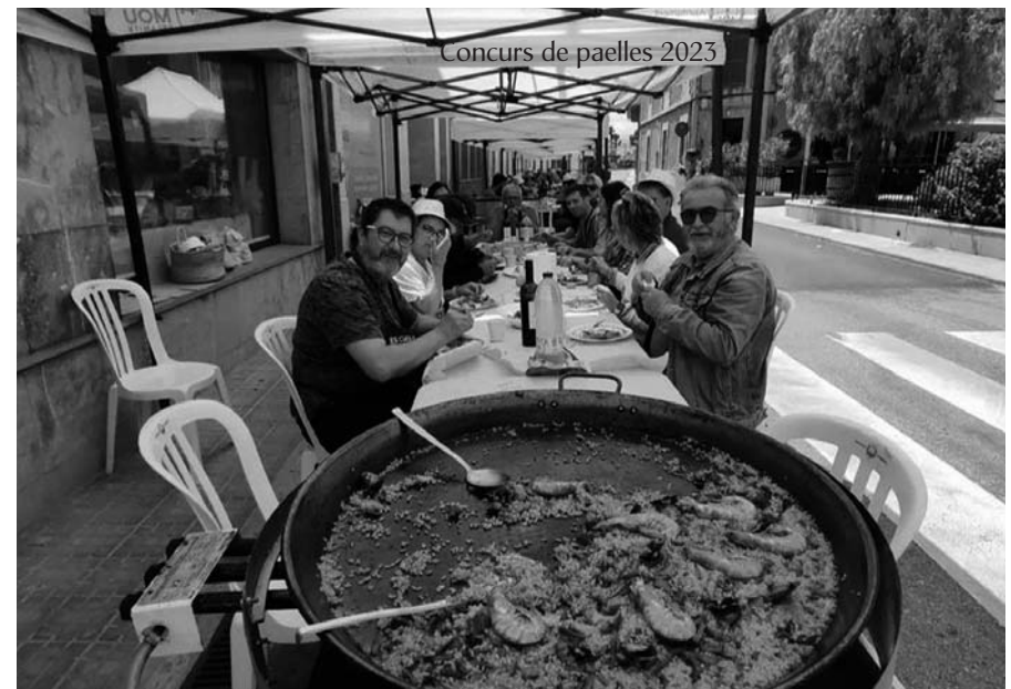
Concurs de paelles 2023