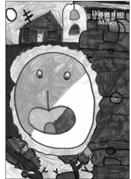
Dibuix d'en Maties