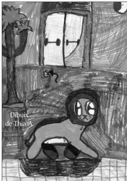
Dibuix de Thia A