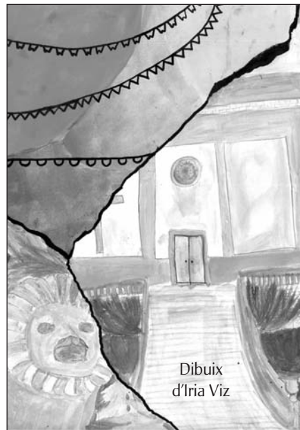
Dibuix d'Iria Viz