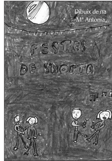
Dibuix de na Mª Antònia