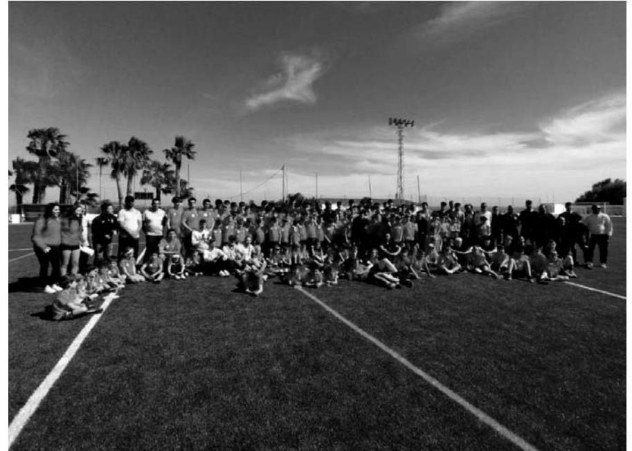
Inauguració de la gespa del camp de sa Lleona