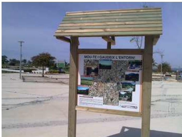
Panell informatiu de sortida de la ruta